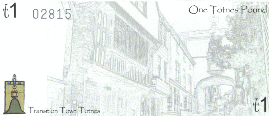
Figuur 3 Voorzijde van Totnes Pound (derde uitgifte)

deze ponden lokale activiteit konden stimuleren, werd niet langer als visualisering opgenomen. De biljetten werden ook kleiner (figuur 3 en 4).