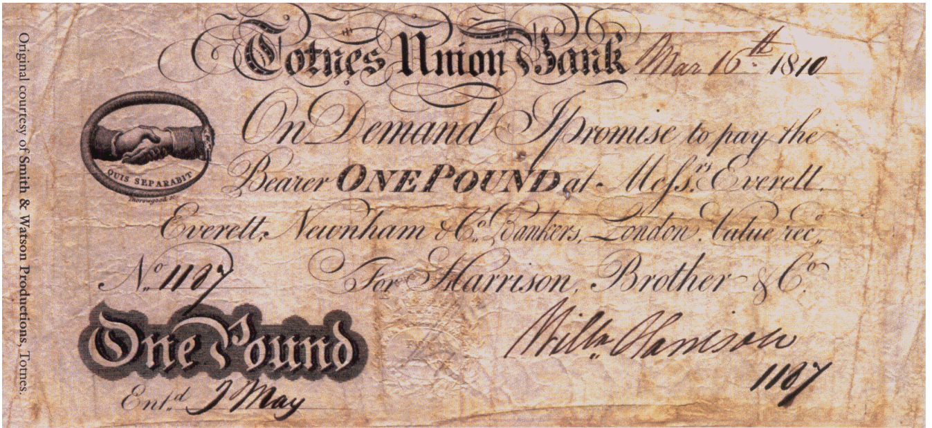
Figuur 1 Voorzijde van Totnes Pound (eerste uitgifte)

De achterzijde (figuur 2) gaf de nodige uitleg en vermeldde de winkels, zaken en andere plaatsen waar het Totnes Pound als betaalmiddel aanvaard werd. Er was aan de linkerkant ook een dubbele rij vakjes voorzien die konden ingevuld of aangekruist worden iedere keer het Totnes Pound ergens ter betaling gebruikt werd. De bedoeling daarvan was om duidelijk te maken dat dit stukje papier (om het even niet als een bankbiljet te zien) keer op keer iemand in Totnes van een inkomen kan voorzien, en dus keer op keer een (economische) activiteit kan genereren binnen de eigen gemeenschap. Met slechts 300 van deze ponden in omloop is het effect natuurlijk verwaarloosbaar, maar het idee zit er wel. Een voorbeeld maakt het duidelijker: stel je betaalt er je groententas mee bij Riverford Farm . Als die tas 5 pond kost, dan kan je met 5 van deze Totnes Pounds betalen (of met 2, aangevuld met 3 gewone Britse ponden, of elke andere combinatie). Riverford Farm vinkt het eerste hokje af. De mensen van Riverford Farm kunnen ze vervolgens gebruiken, bijvoorbeeld voor de (gedeeltelijke) betaling van een kayaktochtje op de Dart. Totnes Kayaks vinkt het tweede hokje af. En gebruikt vervolgens de verdiende Totnes Pounds om er een boek mee te gaan kopen in Harlequin Bookshop . Enzovoort.